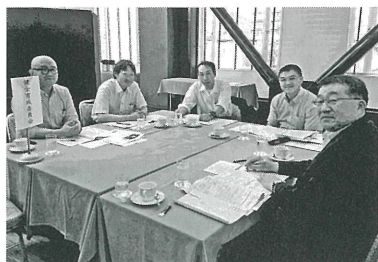
▲健全育成委員会 登校時一声運動・マナーアップ運動が活動の中心。家庭・学校・社会が人を育て、人が家庭・学校・社会をつくることを再認識していきたい。