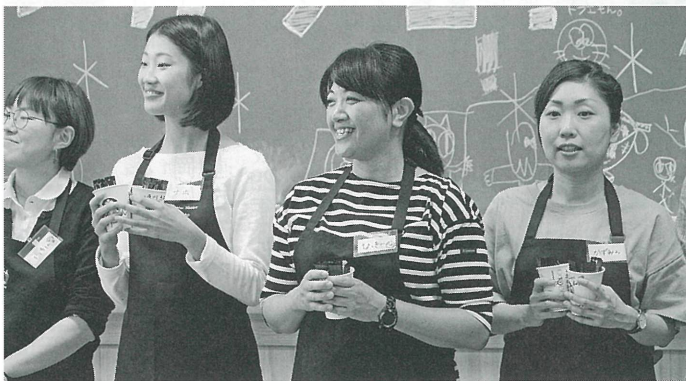
▲母親委員会「道のカフェ」