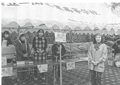
▲関工祭模擬店名物 おでんも大好評

者への貴重な情報提供の場として大きな役割を担っており、参加率が非常に高い行事になっています。 母親委員会は本校の文化祭にあたる「関工祭」で模擬店の企画運営を行っています。特におでんの販売は名物として好評をいただいています。広報委員会は年に二度、PTAの活動や生徒たちの学校での様子をPTA会報の発行によりPTA会員に伝えています。 また、通学路指導を行っている健全育成委員会は、生徒の安心と安全を守る重要な活動になっています。それぞれの委員会の活発な活動により、私自身も支えていただいていると感じています。今後も我々PTAの活動が、生徒たちの学校生活をより充実したものにできるように努めてまいりたいと思います。