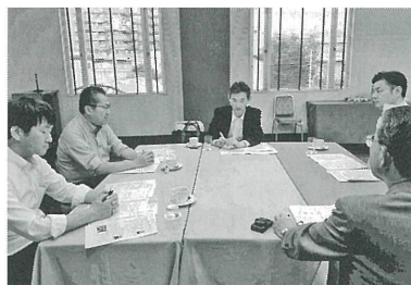
▲進路対策委員会 昨年に引き続き、今年も離職率の現状と企業が求める人材に関する講話を聞き、子どもの進路について学んでいきます。