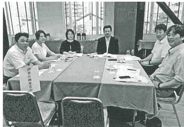
▲調査広報委員会 主な活動は会報ポロニアの発行と広報紙コンクールの運営です。審査会は事務局校を中心におこないます。