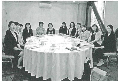
▲母親委員会 次回会うのは、9月の母親会員交流会当日です!例年各地区協議会・ブロックにおける交流会もさかんて、アロマテラピーや味噌造り体験など、少人数であることの利点を感じられる活動がおこなわれています。