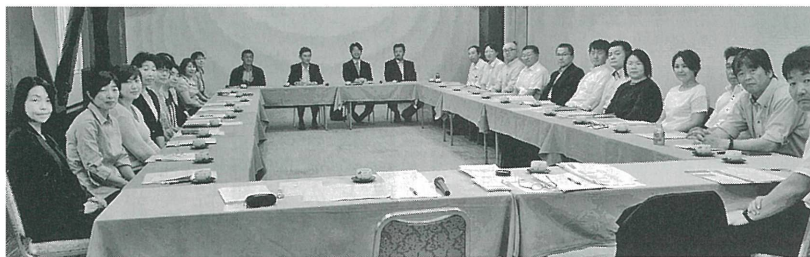
▲合同委員会 4つの委員会が一堂に会します。いずれの委員会も委員長選出校のP T A担当の先生方にいろいろとお世話になっております。