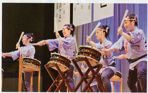
▲大船渡東高等学校太鼓部