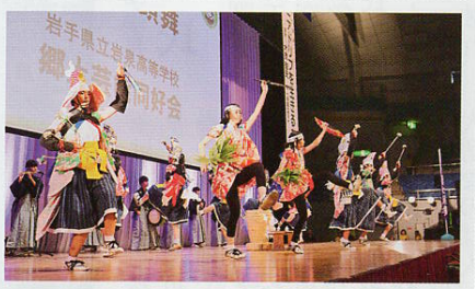
▲岩泉高等学校郷土芸能同好会