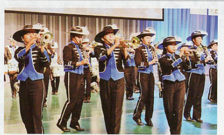
▲盛岡市立高等学校吹奏楽部 Pleasure Star