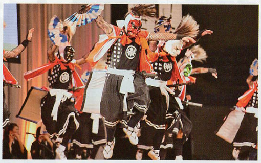
▲北上翔南高等学校鬼剣舞部