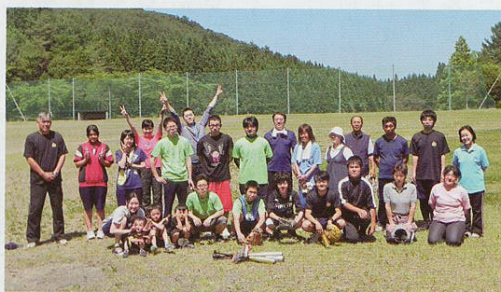
▲ソフトボール交流試合

本校は昭和23年福岡高等学校定時制浄法寺分校として創立されました。その後、昭和50年には地域の熱い要望により独立校として開校しましたが、平成20年、少子化の影響に伴い福岡高等学校浄法寺校として再出発することとなりました。現在、生徒は3年生9名のみですが、「小さくともキラリと光る」学校をモットーに先生方のご指導のもと、元気に勉学や諸活動に励んでおります。 PTA活動の特色としては「参加率の高さ」と「学校行事に親も参加し、一緒に楽しむ」ことが挙げられます。総会は平日夕刻開催にも関わらず、例年7割以上の参加をいただき、PTA活動