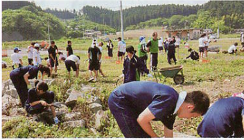
▲被災地ボランティア