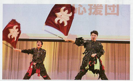
▲花巻北高等学校応援団幹部