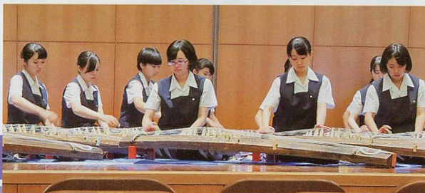
▲全国高P連大会 岩手大会での演奏 盛岡第二高等学校箏曲部