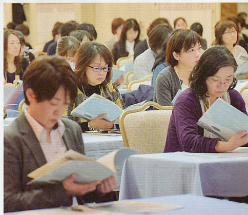
▲講演に耳を傾ける母親会員

第15回母親会員交流会は10月28日（水）盛岡市のサンセール盛岡で開催されました。会員約140人が参加し、食育をめぐる講演を聴いた後、日頃の母親委員会の活動などについて参加者がグループ討議をしました。