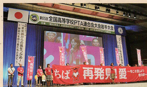
▲来年は千葉大会 / 閉会式でアピールする千葉高P連の皆様