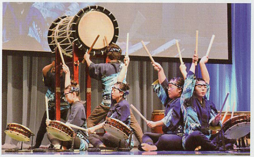
▲宮古水産高等学校太鼓部