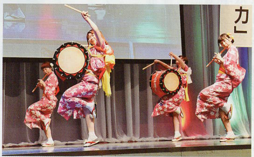
▲岩手県立大学さんさ踊り実行委員会