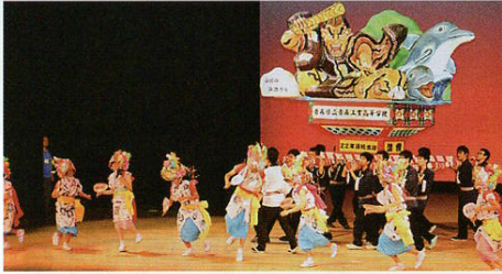
▲伝統の技を伝える 青工高担ぎねぶた

8月に全国高P連岩手大会が開催されるといふことで、「岩手大会決起集会」を特別に企画していただき、「東北はひとつ」を合言葉に会場の皆さんから岩手に対する熱い声援をいただきました。最後に青森工業高校による「青工高担ぎねぶた」の勇壮な演技があり、閉会行事と続きました。研究協議、講演会そして高校生による多くの発表があり充実した大会となりました。