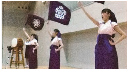
▲今年125周年を迎えた盛岡第二高校応援委員会