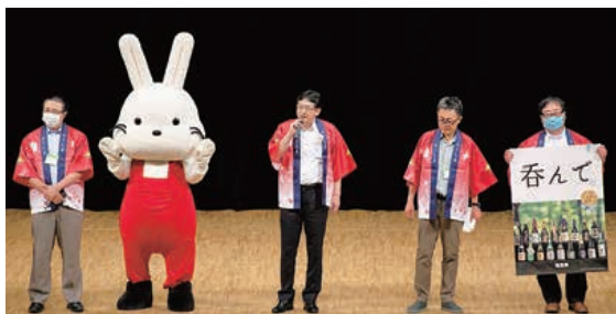
▲福島大会実行委員のメンバー

同大会実行委員のメンバーは、「来年の大会がより良い研究や交流の場となること、そして皆さまに美味しい食や豊かな文化を通して、福島県の魅力を感じていただけるよう頑張ってください」と、意気込みを語りました。