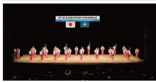
▲街の伝統を受け継ぐ盛岡商業高校盛商さんさ実行委員会