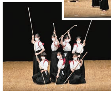
▲凛とした演技が光る盛岡第二高校なぎなた部