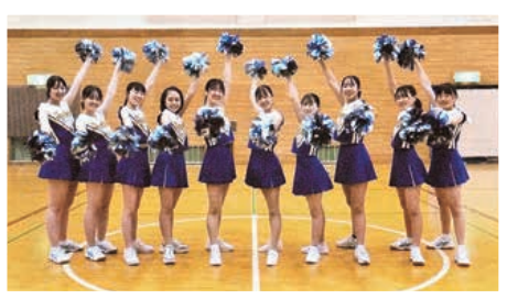
▲10名で活動する不来方高校チアダンスサークル