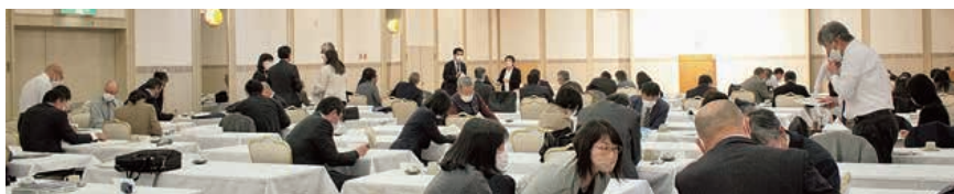
▲地区ごとの打合せ