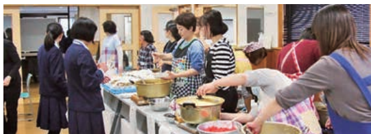
▲まいど食堂(平成30年度)

今後も、宮古商工高校を宜しく願います。全国的に少子化が進み、高校再編は今後も進むことでしょう。特色を活かし、机上の学問で終わる事なく、学びを深めて、社会に出た際の一助になれるよう、保護者も、教職員と手を携え、円滑な学校運営に協力頂きたいと思えます。