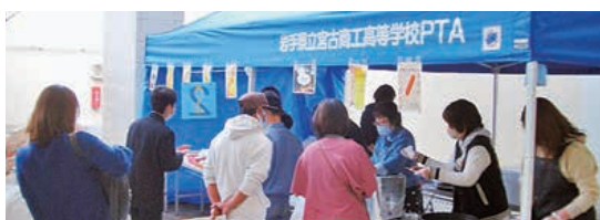
▲工業祭(母親委員模擬店)