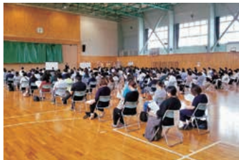
▲3学年PTA・進路講演会

盛岡三高は、いわゆる団塊の世代の就学人口増加を受け昭和38年に創立され、今年60周年を迎えました。現在は各学年7クラス856名が在籍。少子化が進む中で規模をキープできているのは、先生方のご指導と生徒たちの努力による充実した進学実績と活発な部活動、そして明るく爽やかな行動が中学生と保護者の心を掴んでいるからではないかと思えます。さて、PTAはここ数年、行事は軒並み中止・リモートでした。そのような中、今年7月に行われた東北高P連盛岡大会は、予想を超える多くの方が積極的に参加されました。せっかく入学したのになかなか学校との繋がりが持てない、との思いもあるのではないのでしょうか。先日は三高祭に3年生の保護者を受け入れ、また3年生PTAと進路講演会を開催するなど、少しずつ保護者と学校の繋がりが復活してきたと感じます。生徒たちは様々な制約を受ける中でも、部