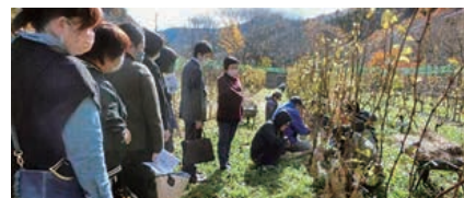
▲研修部 事業所見学

活動や交友関係などを工夫しながら生き生きと楽しんでいるようです。本校の校訓は「随处為主」。これは「どんな場合にも主体性を持って臨みなさい。そのことがいかなる変化にも対応できる生き方なのです。」という教えです。生徒たちはまさにこれを体現しており、頼もしく・誇らしく感じます。PTAはその主体的な活動をそとフォロワーしてあげられるような存在でありたいと思えます。