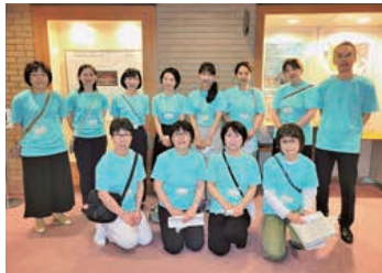
▲東北高P連 盛岡大会