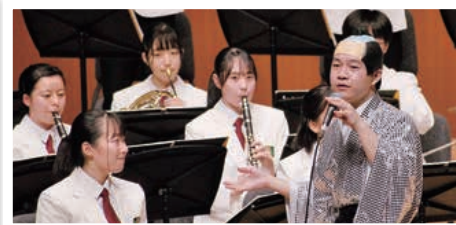
▲ヒット曲で会場を盛り上げた盛岡第一高校吹奏楽部