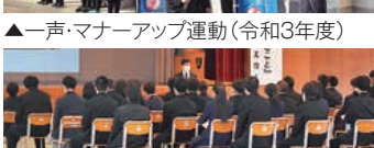
▲親子で受講する開校記念講演会1(令和4年度)

住田町PTA連合会に所属し、町内の異校種団体との情報交換を行いつつ連携をも図っています。 ここ3年間はコロナ禍により、PTA活動も思うように展開することができず、歯痒い思いが続いております。しかしながら、全校生徒数に比例してPTA会員の少ない小規模校とはいえ、今後も「無理せず、できる範囲で協力しましょう」を合言葉に、PTA活動に取り組んで参ります。