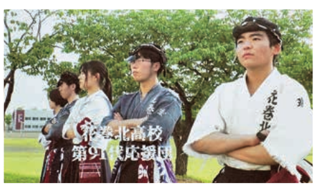
▲パンカラスタイルを継承する花巻北高校応援団