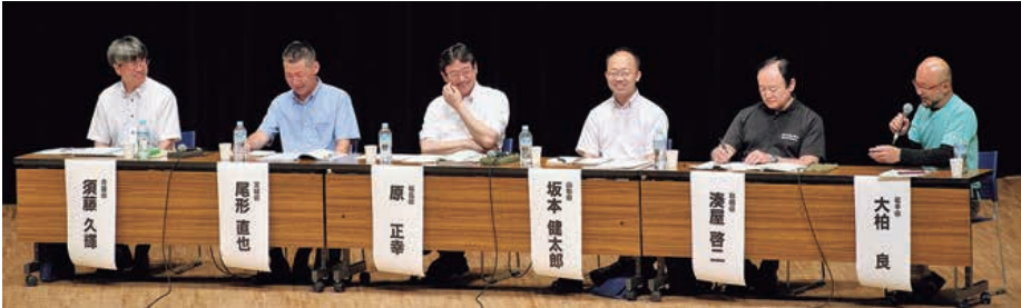
▲各県を代表するパネリスト

また持続可能なPTA活動を行うにあたり、教職員の働き方改革への考慮も挙げられました。地域の力を借りることで教職員の負担を軽減するだけでなく、子どもたちの学びをより深めることができる。こうした取り組みを長年続けている事例もあり、コロナ禍においてもオンラインに切り替えて継続し、参加者は年々増加していると報告がありました。