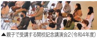
▲親子で受講する開校記念講演会2(令和4年度)

えてきた歴代会員と多くの関係各位に心から感謝申し上げます。 本校のPTA役員は、入学年次毎に地区割をして互選する方式を採りながら、活動してきました。年3回のPTA理事会を開催し、学校行事の支援・連携を確認したうえで、協力体制が定まるよう調整を行ってまいりました。毎年、親子で受講する開校記念講演会と同時開催のPTA総会(登校時二声運動・マナーアップ運動)の継続的参加協力。また、年2回発行のPTA会報を通じて、情報公開・広報活動を行っております。加えて