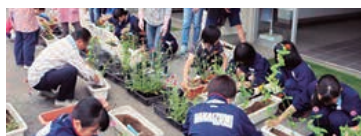
▲プランターづくり