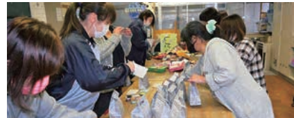
▲事業部 菓子袋詰め作業