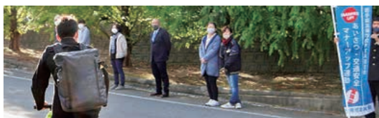
▲登校時一声運動・マナーアップ運動